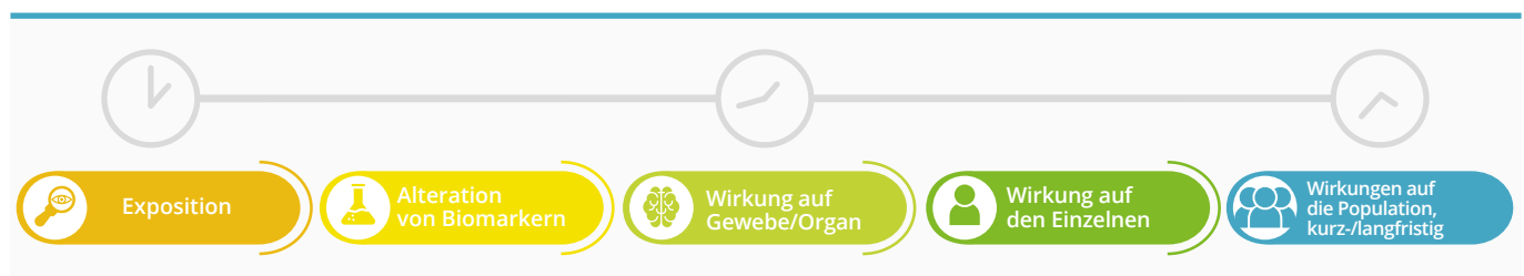
Abbildung 1: Zeitleiste der Effektbiomarker: Von der Exposition bis zur Wirkung.

Das Verwenden von Effektbiomarkern hat in den letzten Jahrzehnten deutlich zugenommen. Sie werden zum Messen der Wechselwirkung zwischen einem lebenden Organismus und xenobiotischen (chemischen, physikalischen oder biologischen) Substanzen verwendet. Besonders nützlich sind sie beim Beurteilen des Risikos eine bestimmte Krankheit zu entwickeln. Effektbiomarker liefern Informationen, die das Minimieren schädlicher Auswirkungen, das Durchführen wirksamer präventiver Interventionen und das Identifizieren von Personen ermöglichen, die für bestimmte chemische Verbindungen anfälliger sind.